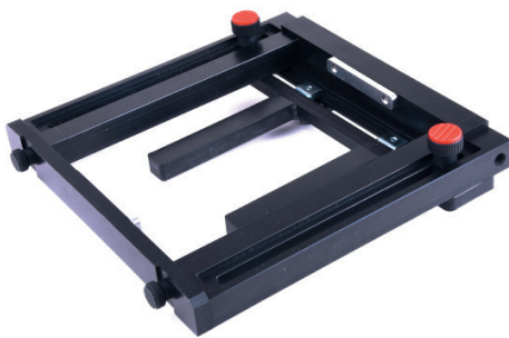
Ansicht von unten: Schnelle Montage der Positionierhilfe

Die Positionierhilfe ist mit einem Maßstab bedruckt. Damit können Positionen für unterschiedliche Packmittel leicht dokumentiert und eingestellt werden.