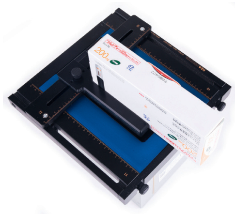
Maßgenaue Positionierung des Probestückes