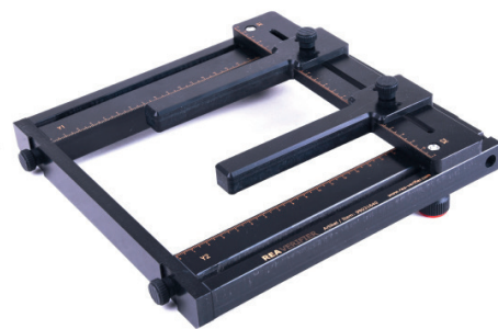
Ansicht von oben: REA VeriCube Positionierhilfe