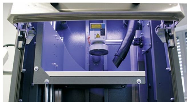
Flexible Platzierung des innenliegenden Absaugschlauches