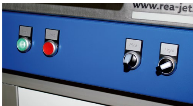
Bedienfeld für Grundfunktionen der Laser Markierstation