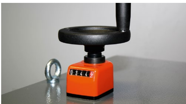
Manuelle Höhenverstellung des Produktaufnahmetisches