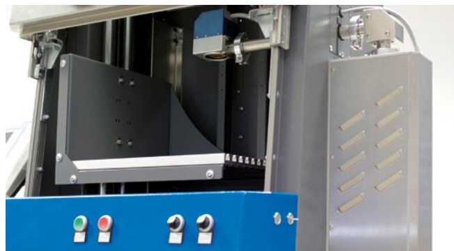
Seitlich montierter REA JET CL CO 2 Laser