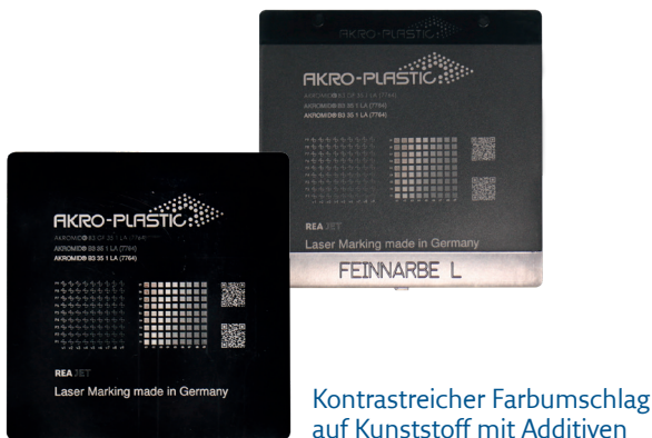
Kontrastreicher Farbumschlag auf Kunststoff mit Additiven