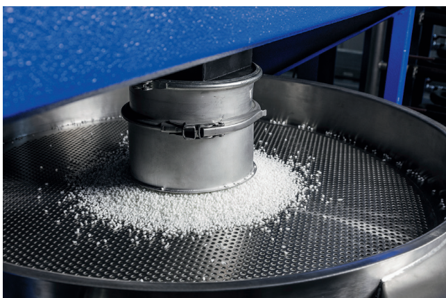
Mischen des Compounds