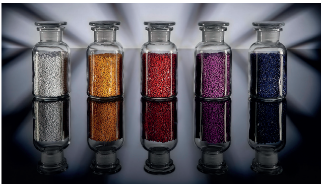
Kunststoff Masterbatches in unterschiedlichen Farbvarianten

Lasersensitive Additive sind ebenso als Masterbatch bei AF-COLOR erhältlich und können mit verschiedenen Polymeren kombiniert werden.